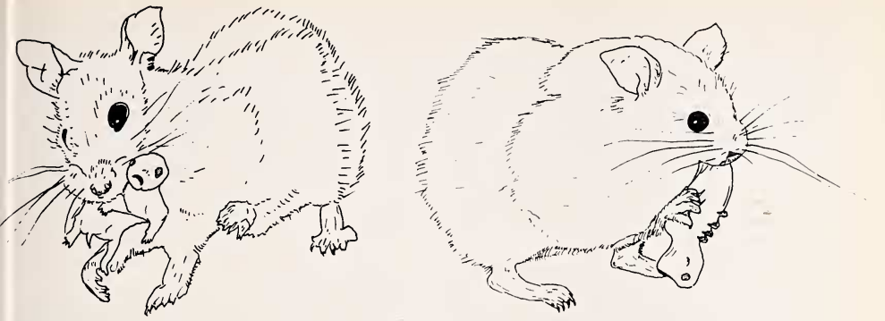
Abb. 1 (links). Aufnehmen des Jungen zum Backentaschentransport: das Kind wird seitlich gefaßt — Abb. 2 (rechts). Mit den Vorderpfoten dirigiert die Mutter den Säugling in die zum Einschieben in die Backentaschen günstigste Lage

durch Drehen und Wenden mit den Vorderpfoten das Junge in die zum Einschieben in die BT günstigste Lage (Abb. 2) oder aber sie nimmt den Kindeskopf ausnahmsweise ohne „Probierbewegungen“ ins Maul auf und schiebt das Junge mit Unterstützung der Vorderpfoten in ihre BT. Der Kindeskörper wird zunächst bis über Körpermitte eingeschoben: die nachschiebenden und zurechtrückenden Vorderpfoten greifen dabei seitlich am Kopf des Jungen an (Abb. 3). Die Mutter unterstützt den Kopf des Kindes mit beiden Vorderpfoten. So kann es in waagerechter Lage, wie auf einer Leitschiene, eingeschoben werden (Abb. 4).